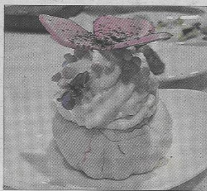
Postre con violetas y merengue, de Joan Roca.

El chef Joan Roca, el autodenominado postrero Jordi Roca y el sumiller y maestro de sala Josep Roca ("responsable de la cocina líquida") aterrizaron en Madrid en el marco de una gira por distintas ciudades españolas apadrinada por el BBVA. La ex-